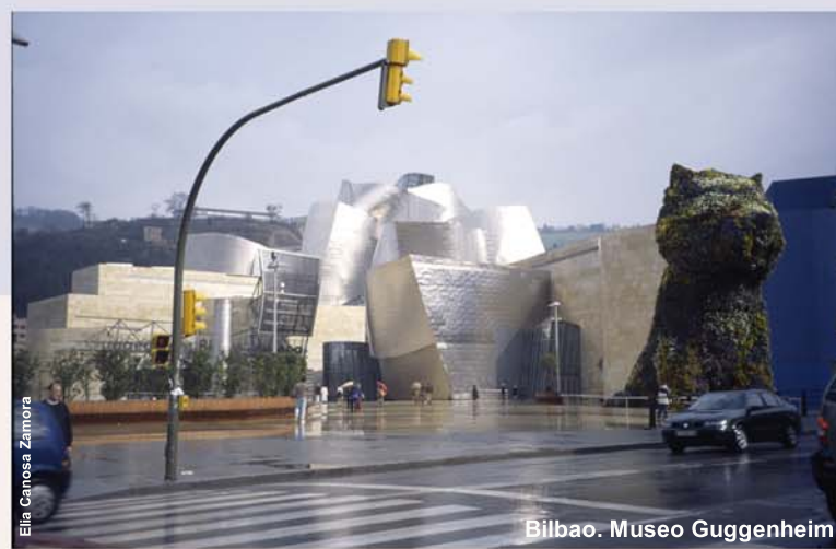
Bilbao. Museo Guggenheim.